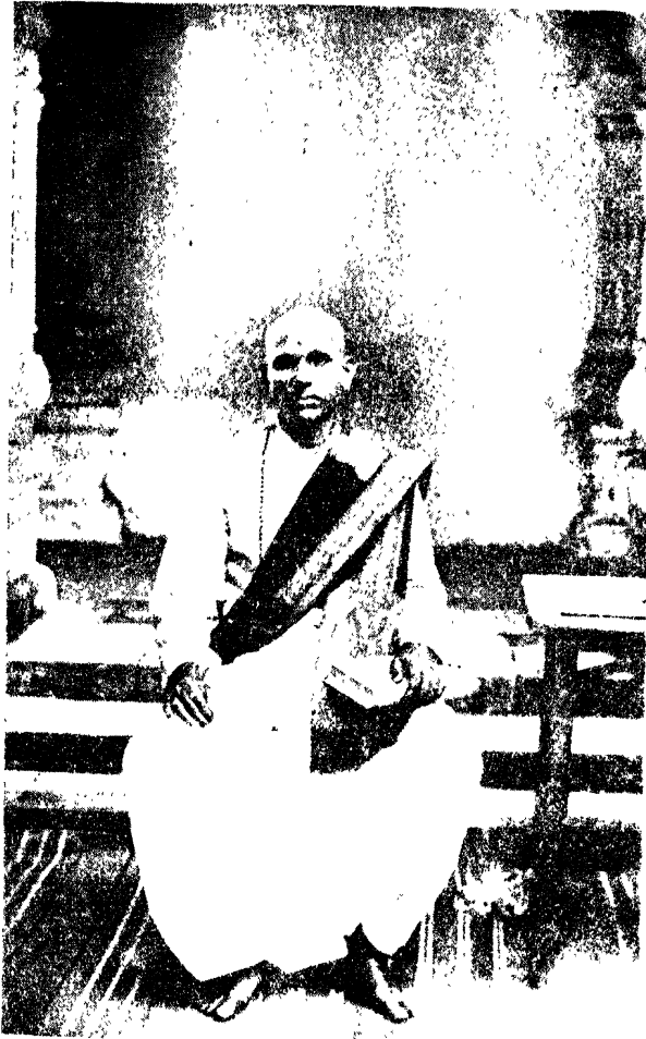
जयपुरमंस्थानद्वारुपाणि न महोपाध्याय स्वयंभवापायक श्रीरघुनाथनन्ददासः ॥